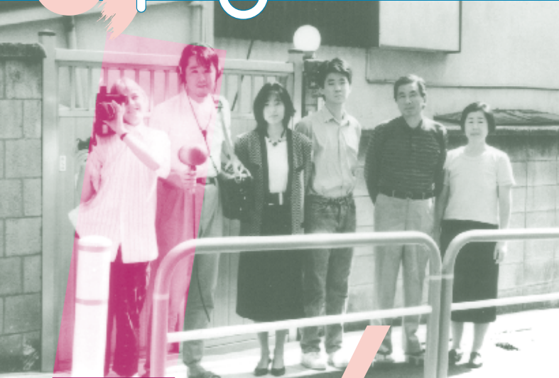
7.14[土] BOTA theater『家族写真』